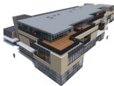
Artist impression van het winkelcomplex met de te realiseren appartementen

is. Dan loop je geen onnodige risico's. De dienstverlening met veel service en kennis van zaken is veel waard." Naast het Discus Spaarsysteem kunnen relaties van Onderlinge Geesteren Gelselaar eenmalig profiteren van een aantrekkelijke korting bij Discus Florijn. Ze krijgen € 10,00 korting bij een minimale besteding van € 50,00. Om van deze actie gebruik te maken, kunt u de tegoedbon downloaden en printen via www.ovm.nl/discusflorijn