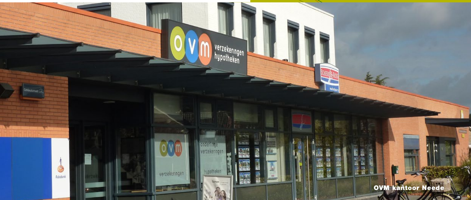
OVM kantoor Neede